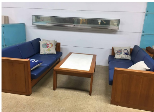
3.擬改造原有漫畫區-數位區