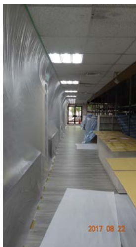
2.走廊書庫區保護措施