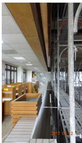
3.女兒牆外側層板安裝(3~RF)