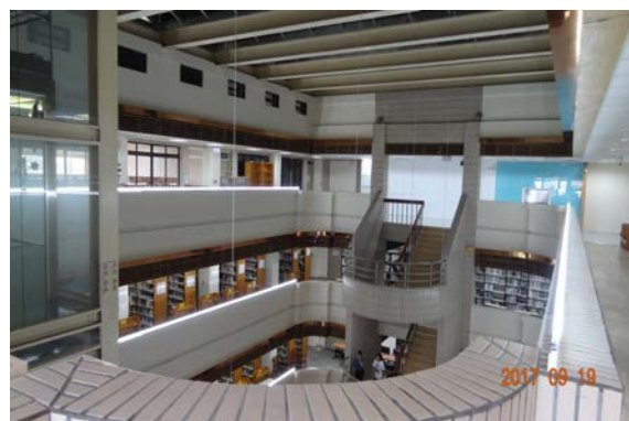
4.女兒牆上方增設 LED 照明