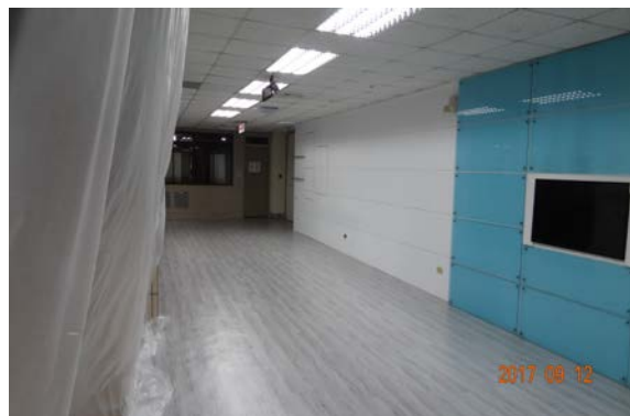
5.國際瞭望角鋪貼塑膠地磚