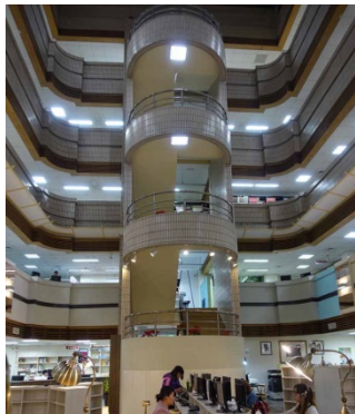
1.圖書館中庭照明不足