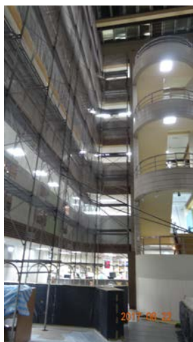
1.中庭女兒牆外圍搭設鷹架