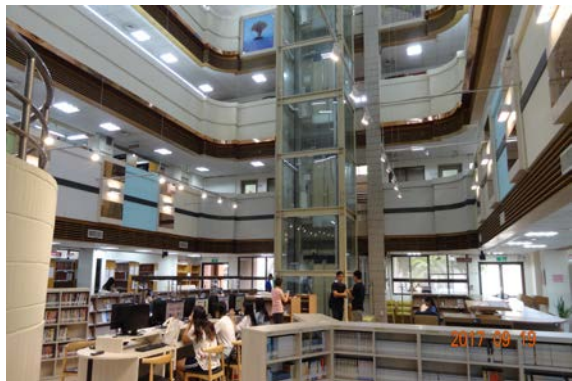
1.中庭照明改善完成