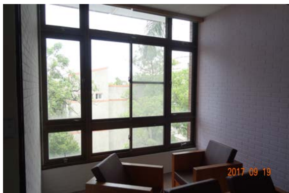
5.西側陽台油漆美化完成