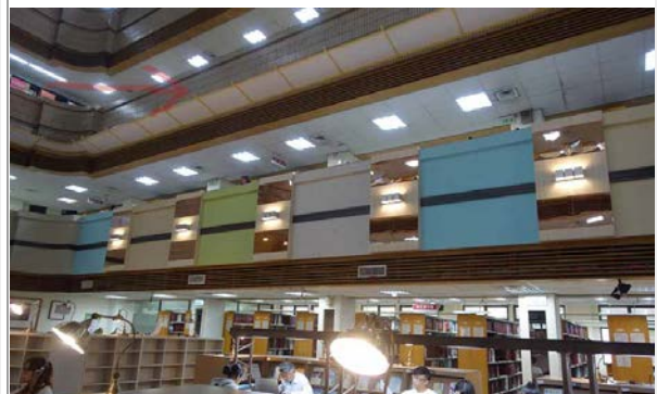
2.圖書館中庭女兒牆磁磚剝落